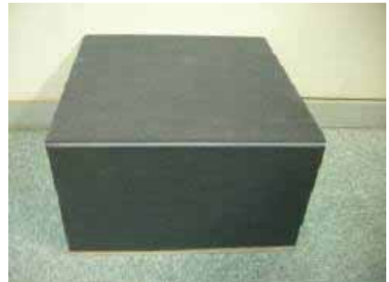
写真1 ECCOSORB® VHP-FLの外観